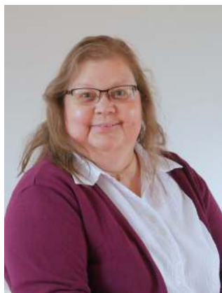
Mareike to Baben-Yang, Lehrte-Ahlten

Der Kirchenvorstand vertritt die Kirchengemeinde. Er verwaltet deren Vermögen und ist somit für alle finanziellen und administrativen Angelegenheiten zuständig. Seine Aufgaben sind im Kirchenvermögensverwaltungsgesetz und der Geschäftsanweisung für Kirchenvorstände festgelegt. Zu ihnen gehören insbesondere die Feststellung des Haushaltsplans, die Prüfung und Feststellung der Jahresrechnung und die Führung eines Vermögensverzeichnisses. Zum Vermögen der Kirchengemeinde gehören alle in deren Eigentum stehende Grundstücke, Gebäude und bewegliche Gegenstände, Rechte, Forderungen, Verbindlichkeiten und sonstige Vermögenswerte.